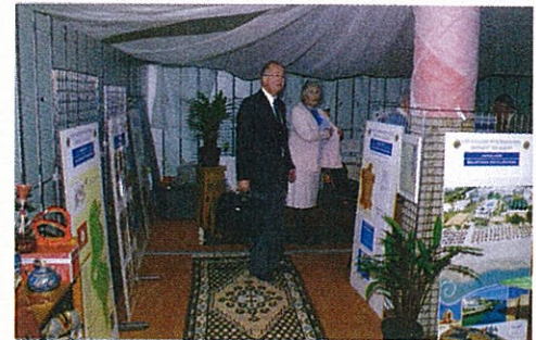
Le stand Relations Internationales

Les Lions Clubs de France sont aussi individuellement concernés à travers les jumelages et les relations privilégiées qu'ils peuvent initier en direction des pays émergents francophones.