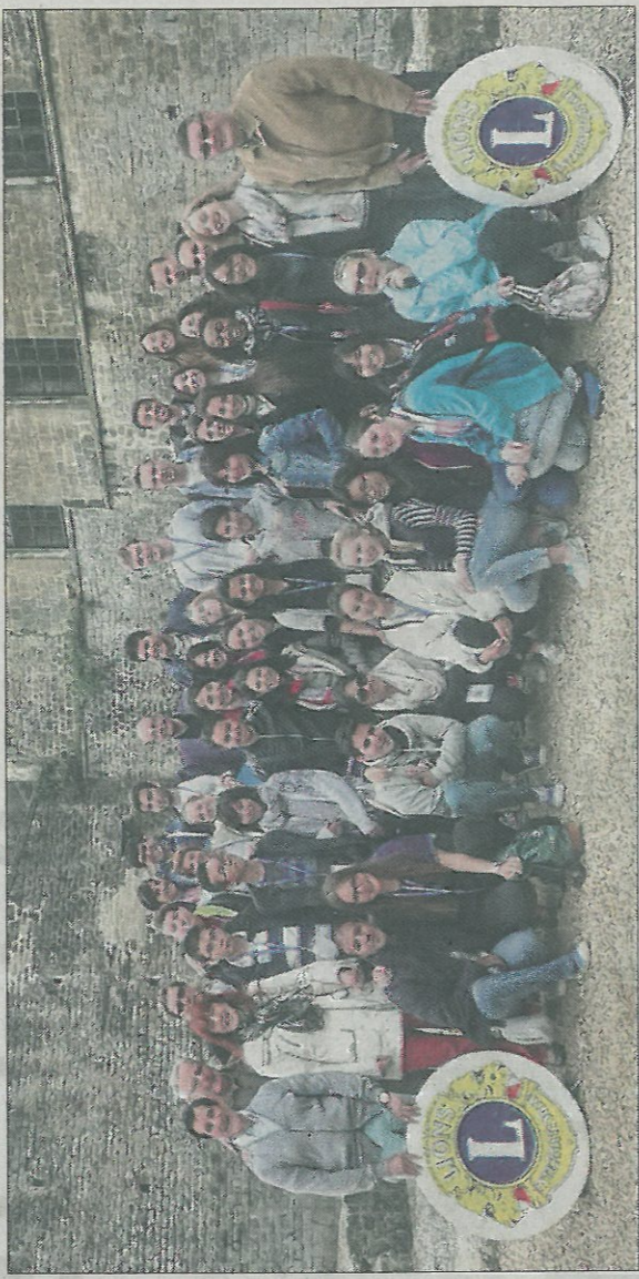
Le périples du groupe se terminera fin juillet.

Une quarantaine de jeunes ont passé la journée de jeudi au château fort de la ville, l'une des étapes de leur voyage en France.