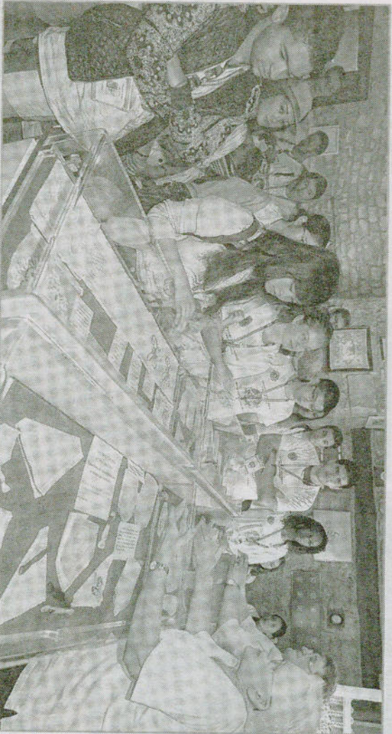
Les quarante-cinq étudiants francophones ont eu droit à une visite guidée au musée de la broderie.

thème « respecter les œuvres, elles sont le patrimoine de l'homme. » Après Strasbourg, Colmar et Epervain, les stagiaires internationaux ont donc fait une halte à Fontenoy-le-