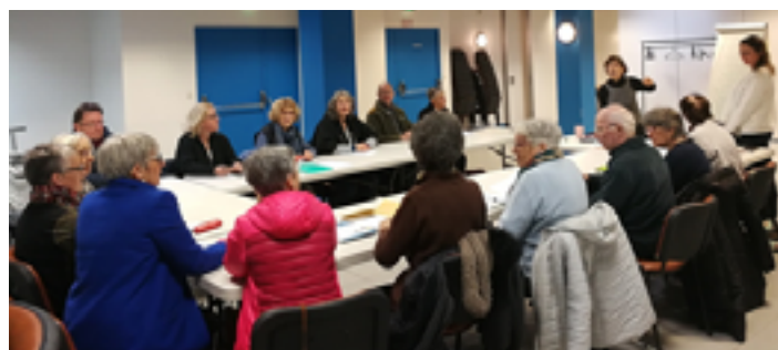
Au cours de la cinquième séance du jeudi 7 mars 2019, seize personnes étaient présentes.

Après la présentation du programme « ENTRAIDE »