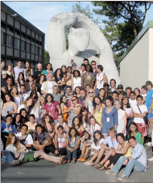
Au lycée Grand Air.

Le centre de La Baule, aujourd'hui dénommé Centre international francophone culturel (CIFC) , fête donc en juillet 2010 son 50 e anniversaire . Renouant avec la tradition, les cinquante stagiaires de trente-trois pays ont visité les clubs de Le Mans, Laval, Saint-Malo, Nantes et, bien sûr, La Baule où ils ont été reçus dans 132 familles Lions et Leo enthousiastes. Après quinze jours studieux au lycée Grand Air de La Baule, ils ont accueilli soixante anciens, représentant les cinq décennies, invités pour la dernière semaine du stage.