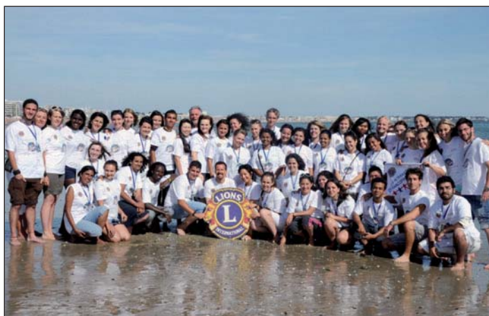
À la plage.