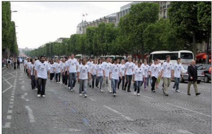
La remontée des Champs-Élysées.